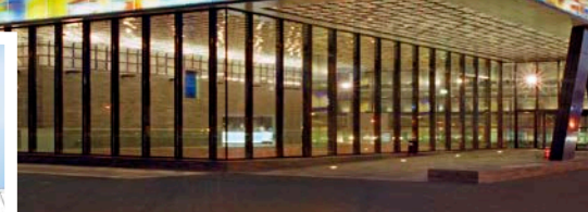
↑ De gevel van Beeld en Geluid in Hilversum.