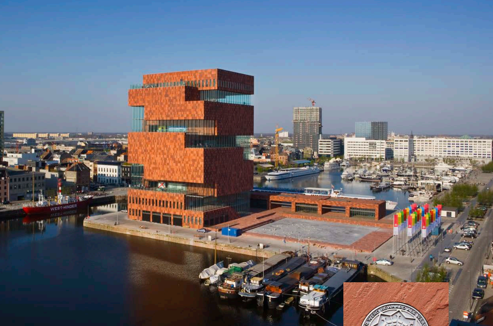
↑ Het MAS op het Eilandje in Antwerpen.