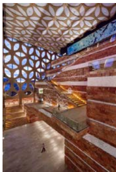
Het atrium van Naturalis Biodiversity Center Leiden.

gebouwd als "black boxes". We hebben daarna bij Naturalis prachtige mogelijkheden gecreëerd om wel noorderlicht in de museumzalen te laten vallen, waardoor je altijd heel mooi strijklicht hebt. Hiervoor zijn de gestapelde museumzalen van Naturalis vertrappt en ten opzichte van elkaar verschoven. Ook in het ontwerp van het Amsterdam Museum zorgen we er nu voor dat de zalen daglicht kunnen krijgen. Want je kunt maar een keer bouwen!