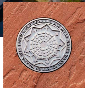
→ Medaillon ontworpen door Tom Lanoye en Tom Hautekiet | MAS Antwerpen.

iedereen deelt, in plaats van te denken vanuit tegenstellingen. Tijdens het ontwerpproces voeren we verschillende overleggen met alle vertegenwoordigers, waarbij we formuleren op welke manier de belangen van alle betrokken partijen zo goed mogelijk tot hun recht komen. De meeste stakeholders vinden elkaar in een zo precies mogelijk gedefinieerde vorm van het openbaar domein: geen vieze hoekjes en nare steegjes, maar een heldere publieke ruimte. Daar hebben zowel het museum als de ondernemers in de omgeving veel profijt van. Bij het Amsterdam museum speelt dit in verhevigde mate, omdat dit museum midden in de binnenstad van Amsterdam ligt, grenzend aan het historische Begijnhof.