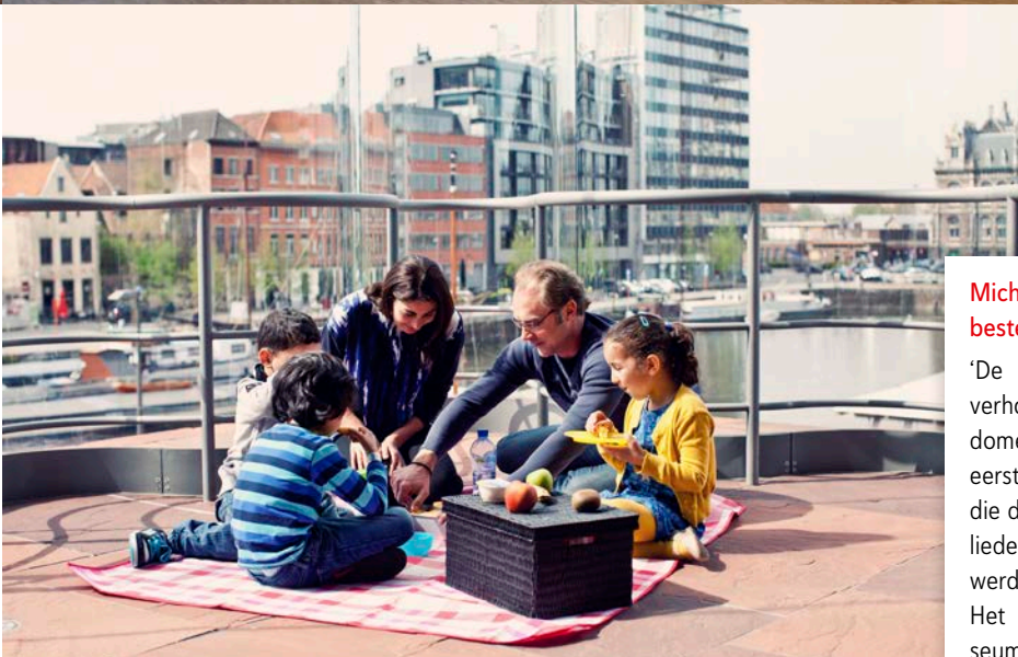
↑ Eemhuis: bibliotheek in Amersfoort. → Picknick bij het MAS.